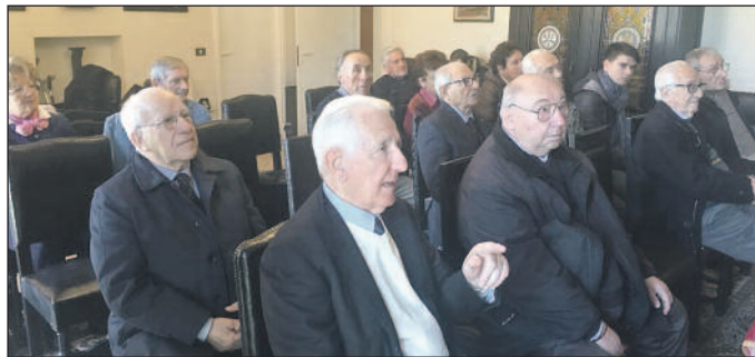
Gli automobilisti iscritti da oltre 30 anni all'Ac di Vercelli